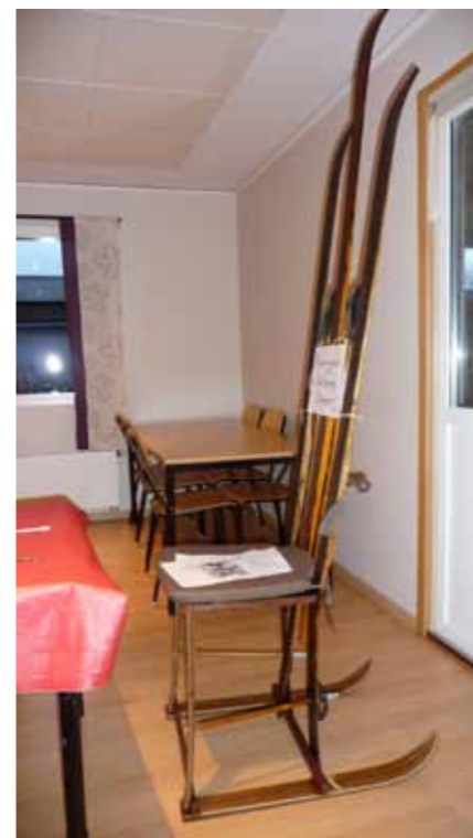
Bild 3. Skidtron till skidkungen Ingvar Carlsson för 40 Vasalopp tillverkad av skidor av Börje Wihlborg.