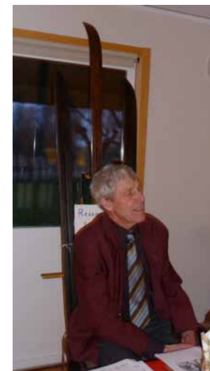
Bild 5. Ingvar Carlsson på sin skidstol.