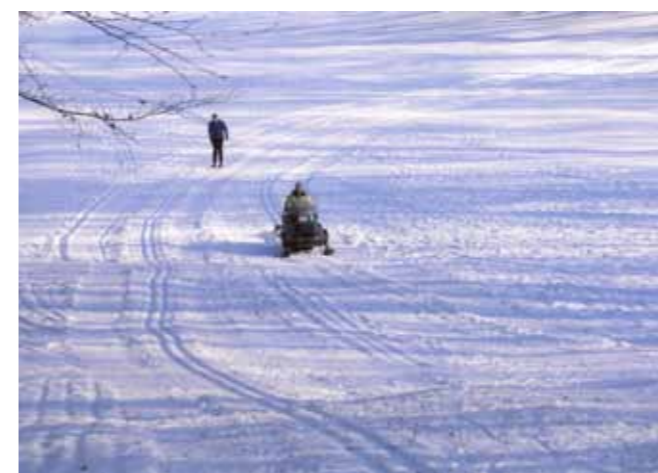
Bild 8. Skåningarna bjöds på fina skidspår i Dörröd i februari tack vare MKK:s spårgrupp.