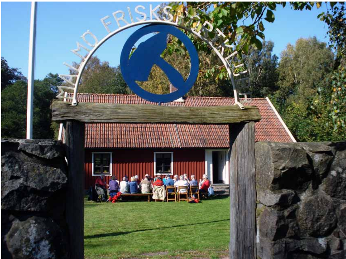
Höstfest i stugan i Dörröd den 25 september 2011.