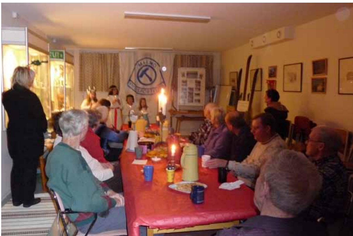
Bild 1. Vacker luciasång av fyra små tjejer på klubben.

Manus till Länken kan skickas till: Malmö Frisksportklubb, Roskildevägen 7, 217 46 Malmö eller Lars Svensson, Dammfrivägen 48 A, 217 63 Malmö Tel.: 040-92 62 49 E-postadress: laurentius@ownit.nu