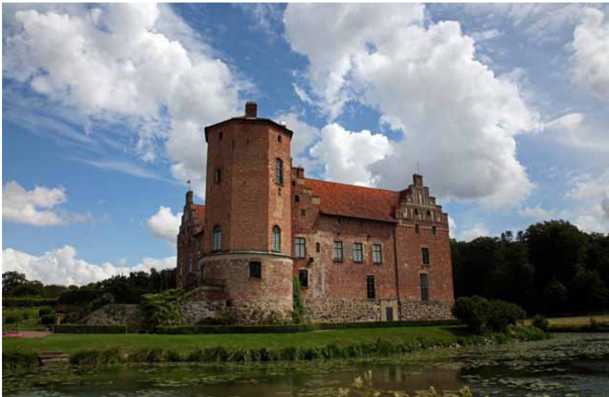
Torups slott ligger i Bara socken och är ett av Nordens bäst bevarade medeltida slott med historia från tiden kring 980. Slottet är beläget inom Torups rekreationsområde, ofta kallat Bokskogen, med motions-spår, promenadstigar, vandringsleder, rastplatser, ridvägar, sjöar och golfbana. – Foto: Kjell Wihlborg 2012.