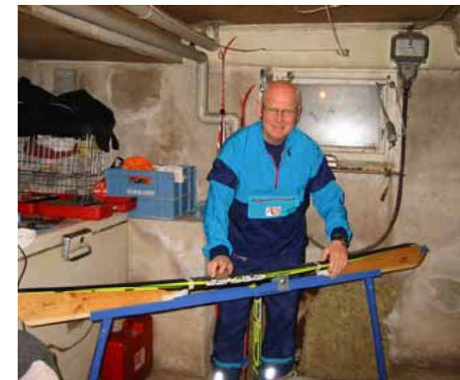
Bild 12. Vallning är en allt viktigare del av Vasaloppsförberedelserna. Artikelförfattaren gör här slutförberedelserna för Öppet Spår måndag 24/2 2013.

Artikelförfattaren har åkt 37 Vasalopp. – För att bli Vasaloppsveteran krävs att man genomfört minst 30 Vasalopp eller Öppet spår. Tillsammans har Vasaloppsveteranerna genom tiderna genomfört närmare 24 000 Vasalopp eller Öppet Spår vilket motsvarar cirka 216 000 mil eller drygt 53 varv runt jorden. – För samtliga resultat i Vasaloppet se Resultatbörsen.– Red.