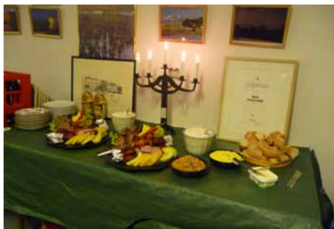
Bild 9. Vackert upplagd årsfestsbuffé.