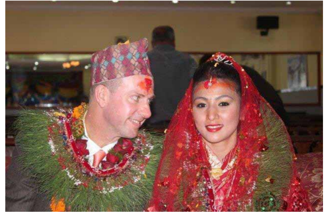
Bild 4. Ett lyckligt brudpar.