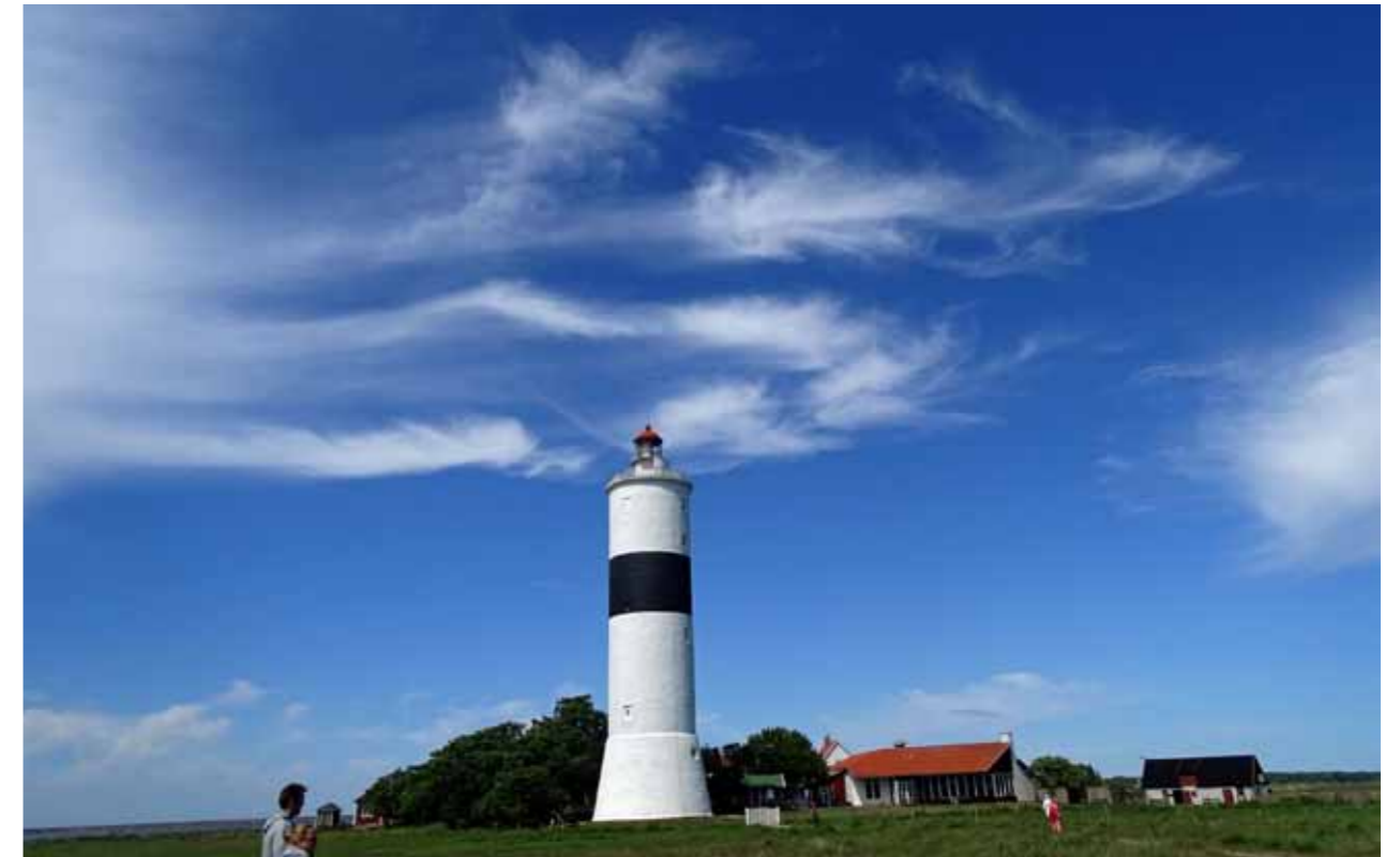
Bild 20. Fyren Långe Jan, Sveriges högsta fyr (41,6 m), belägen längst ned på Ölands södra udde. Vid fyrplatsen ligger Ottenbys fågelstation.

Anmälningsläget inför 2017: Det nya parloppet Nattvasan fulltecknades på en och en halv minut. Vasaloppet var fullt efter fyra minuter! På en timme hade över 33 000 deltagare anmält sig till vinterveckan 2017.