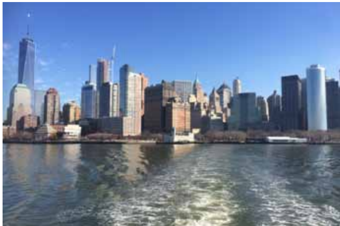
Bild 9. New York.