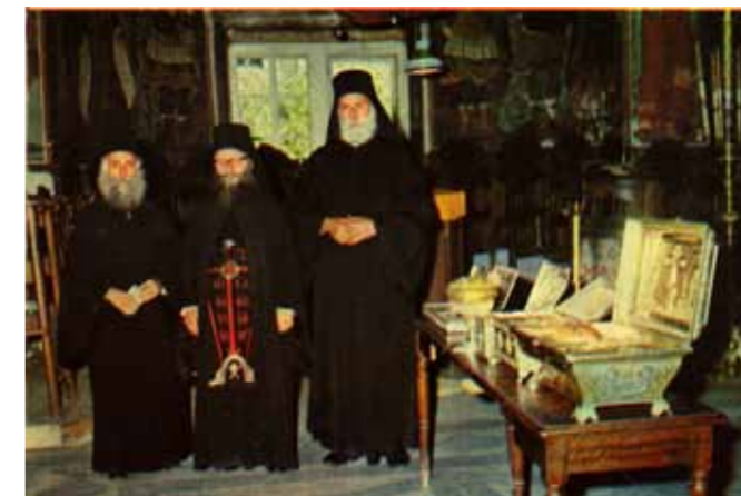
Bild 6. Munkarna har skägg och bär kaftan. Klostren är fulla av dyrbarheter.