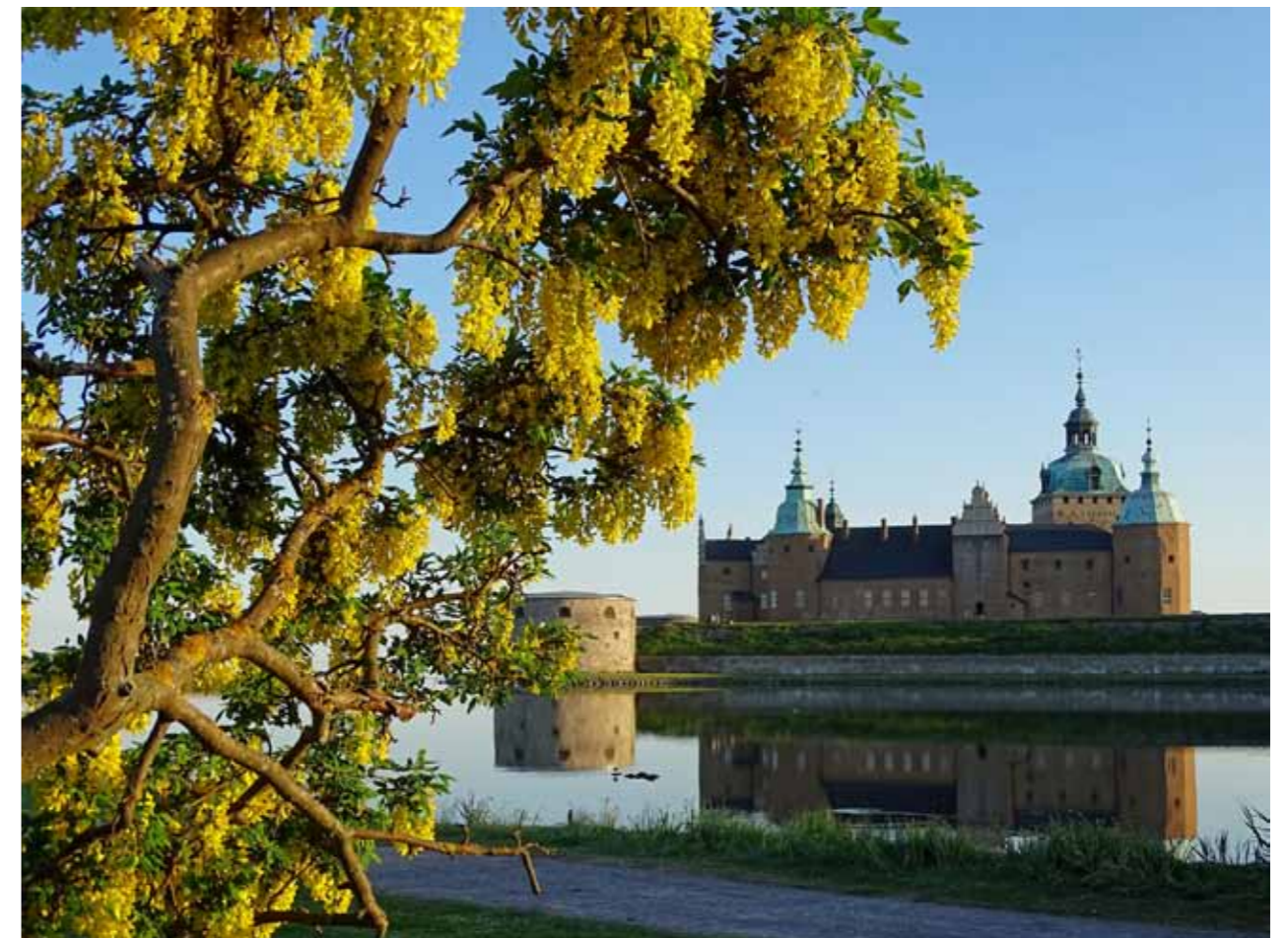
Bild 21. Kalmar – 2016 års sommarstad för andra året i rad. Kalmar slott ligger vid Slottsfjärden, där det medeltida Kalmars hamn låg.