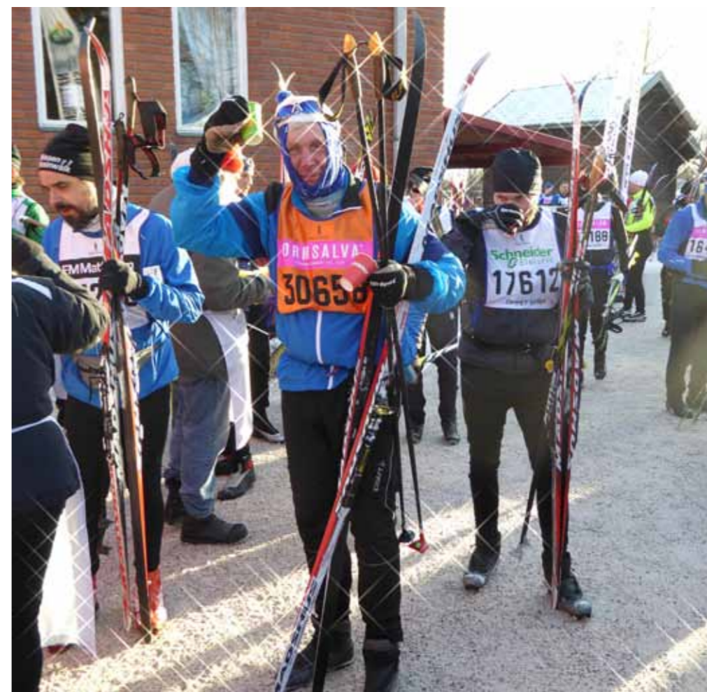
Bild 8. Ingvar Carlsson intar dryck i Evertsberg under sitt 43:e Vasalopp!