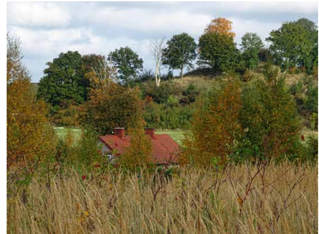
Bilder från Arrie strövområde – en verklig oas! Stora delar av Arriesjöns strövområde är naturreservat med inriktning på friluftslivet. Det finns flera iordningsställda rastplatser i området med bänkar, bord och eldstad. En av grillplatserna är tillgänglighetsanpassad. Vid den södra parkeringsplatsen brukar besökare ibland bada, men det finns ingen badbrygga.